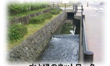
水と緑のネットワーク