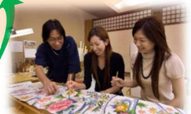
文化体験プログラム