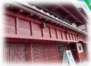
町家を活用した金沢AIビレッジ